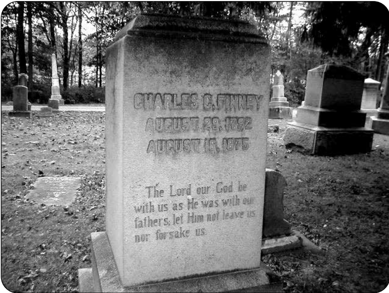
चार्ल्स फिनीको चिहान ढुङ्गो

दिनलाई उहाँले आफ्नो परिवारको बीचमा बिताउनुभयो। बेलुकीको सेवा मण्डलीमा सुरु हुने बेला संगतिको आवाजहरूको बीचमा सूर्य अस्ताउने बेलामा आफ्नो श्रीमतीसँग बाहिर हिँडिरहनुभयो। “त्यति बेला पनि उहाँ एउटा जवान मानिस जस्तै सीधा उभिरहुन्थ्यो, उहाँको सोच्ने क्षमता उल्लेखनीय थियो, र अन्तसम्म उहाँको सोच्ने क्षमता घटेको थिएन। त्यो दिन बेलुकी घरमा विश्राम गर्दा मुटुमा एउटा दुखाइको अनुभव गर्नुभयो, केही घण्टाहरूको दुखाइपछि सूर्य उदाउँदा, सन् १८७५ अगस्ट १६ तारिखमा उहाँको देहान्त भयो। यसरी पूर्ण समर्पणतामा खीष्टको लागि अन्धकारको शक्तिहरूसँग लडन्तमा जिएर लाखाँलाई ज्योतिमा ल्याएको जीवन शान्त पूर्ण रूपमा अन्त भयो; त्यो शताब्दीको शक्तिशाली धार्मिकताको प्रचारक र आत्मा जित्नुमा सफलता हासिल गरेका सेवक भन्ने इनाम उहाँको साथमा गयो।”