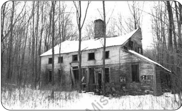
चार्ल्स फिनी जन्मेको घर - वारेन, कनेक्टीकट

हुँदा, मेरो बुवा होनैडा भागमा पर्ने न्यु योर्कमा सर्नुभयो, जुन ठाउँमा प्रायजस्तो जङ्गल नै थियो। त्यहाँको बासिन्दाहरूलाई धार्मिक सेवा पाउने केही मौका थिएन। तिनीहरूको बीचमा थोरै धार्मिक पुस्तकहरू मात्र थिए। मैले सामुदायिक विद्यालयमा पढ्ने मौका पाएँ, गर्मीयाम र जाडोयाम हुँदै, मलाई लाग्छ, १६ वर्षको उमेरसम्म बिताएँ, त्यति बेलाको सामुदायिक विद्यालयको नियमानुसार नै एउटा सामुदायिक विद्यालयमा पढाउन सक्ने व्यक्ति हुन पुगौँ।