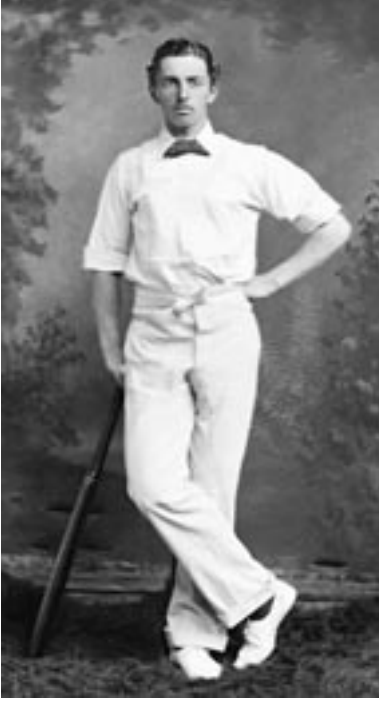
चार्ल्स थोमस स्टड

त्यो समयमा उहाँ क्रिकेट संसारमा ख्याति प्राप्त गरेर प्रख्यात भई जिइरहेको हुँदा उहाँलाई फेरि परमेश्वरप्रति फर्काउनुपर्छ भन्ने निर्णयका साथ दुई जना वृद्ध आमाहरूले उहाँको लागि प्रार्थना गर्न सुरु गरे। यतिखेर उहाँ अस्ट्रेलियाको भ्रमणमा हुनुहुन्थ्यो। उत्तर अचानक आयो, उहाँको दाइ जार्ज, जससँग उहाँ अति नजिक हुनुहुन्थ्यो, अचानक बिरामी भई बाँच्नुहुन्न भन्ने अवस्थामा पुगनुभयो। चार्ल्स (सी.टी. स्टड) सधैं उहाँको नजिक रहनुभयो, जीवन र मृत्युको बिचमा दाइ लडिरहनु हुँदा उहाँले हेरिरहनुभयो र त्यति बेला उहाँको मनमा यस्तो विचार आयो, “अब जार्जले प्राप्त गरेको यति ठुलो विश्व ख्यातिले उसलाई के फाइदा दियो र? सबै प्रसिद्धि र गुणगान के महत्त्वको