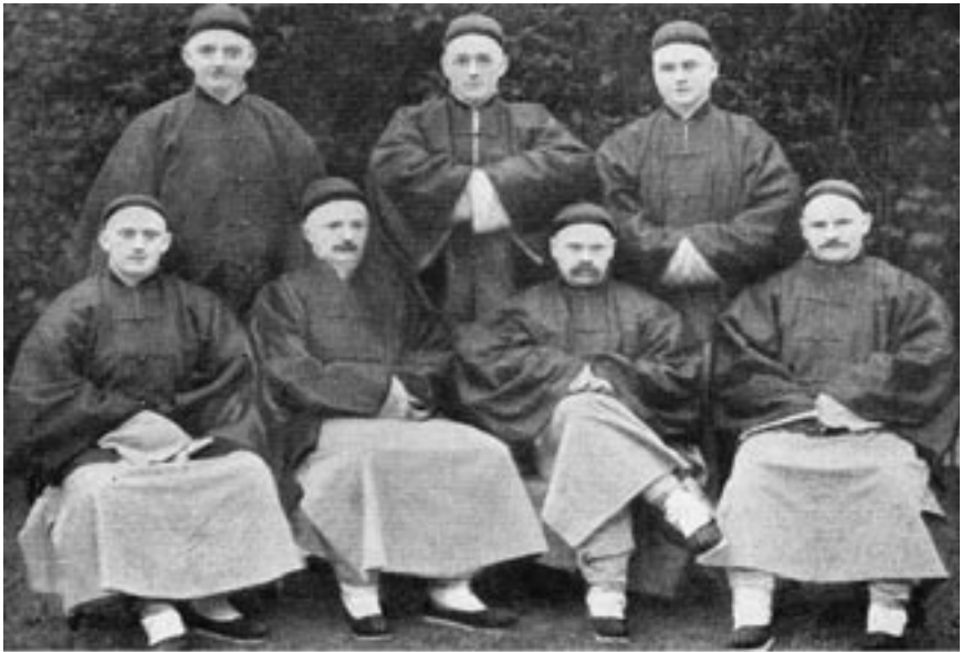
THE CAMBRIDGE SEVEN C. T. STUDD, M. BEAUCHAMP, S. P. SMITH A. T. POLHILL-TURNER, D. E. HOSTE, C. H. POLHILL-TURNER, W. W. CARSEL

अक्सफोर्डमा कन एक्चेन्ज (Corn Exchange) भवन, जुनचाहिँ त्यो सहरकै सबैभन्दा ठुलो भवन थियो, मानिसहरूको भीडले भन्थो। लण्डनमा एक्सटर हलमा भएको सभा सहभागी भएकाहरूले कहिल्यै बिर्सन नसक्ने सभा बन्न पुगेको थियो।