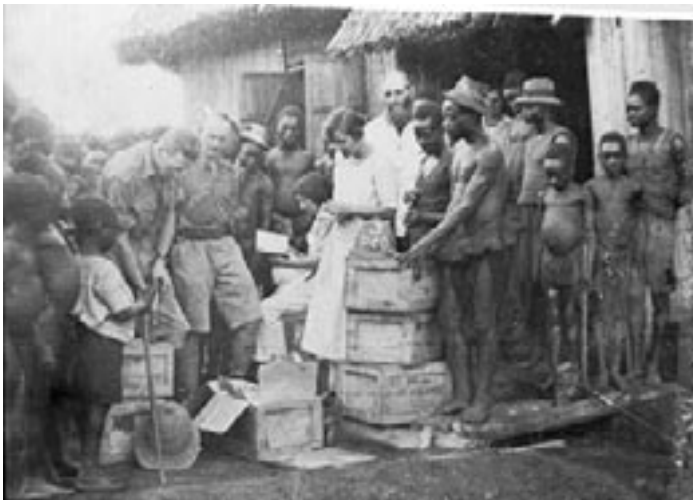
सी.टी. स्टड अफ्रिकीहरूको साथमा

मृत्यु संस्कारको लागि शुक्रवार भेला भएका स्थानीयहरू फर्केर घर नजाँदा शनिवार पनि एउटा सुन्दर सभा भयो, र त्यति बेला तिनीहरूले गरेको प्रार्थनाजस्तो कहिल्यै तिनीहरूले प्रार्थना गरेका थिएनन्। ब्वानालाई स्वर्ग लागि तापनि आफू अझै येशूको लागि बलियो हुने निर्णयको साथ आफूलाई फेरि एक पल्ट परमेश्वरमा समर्पण गर्नुपर्छ भन्ने विचार सबैको मनमा भएको जस्तो देखिन्थ्यो। आइतबारको दिन अझै ठुलो सभा भयो। परमप्रभुको कामलाई देखेर सबै मिशनरीहरू आश्चर्यचकित भए।