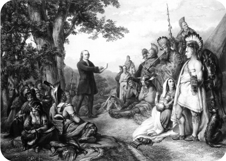
स्थानीय भारतीहरूलाई प्रचार गर्दै जोन वेस्ली

जोन भन्नुहुन्छ, “मैले जर्जियामा पाइला टेक्ने बित्तिकै हरेक दिन बिहान पाँच बजे प्रचार गर्न थालें। अनि सहरका हरेक गम्भीर व्यक्तिहरू वर्षभरि नियमित तवरमा सेवामा सहभागी हुन्थे।” यसबाहेक उहाँ दिनहुँ घर-घरमा मानिसहरूलाई भेट्न जानुहुन्थ्यो। अनि उहाँले हरेक शनिवार दिउँसो विद्यालयमा बच्चाहरूलाई सिकाउनुहुन्थ्यो।