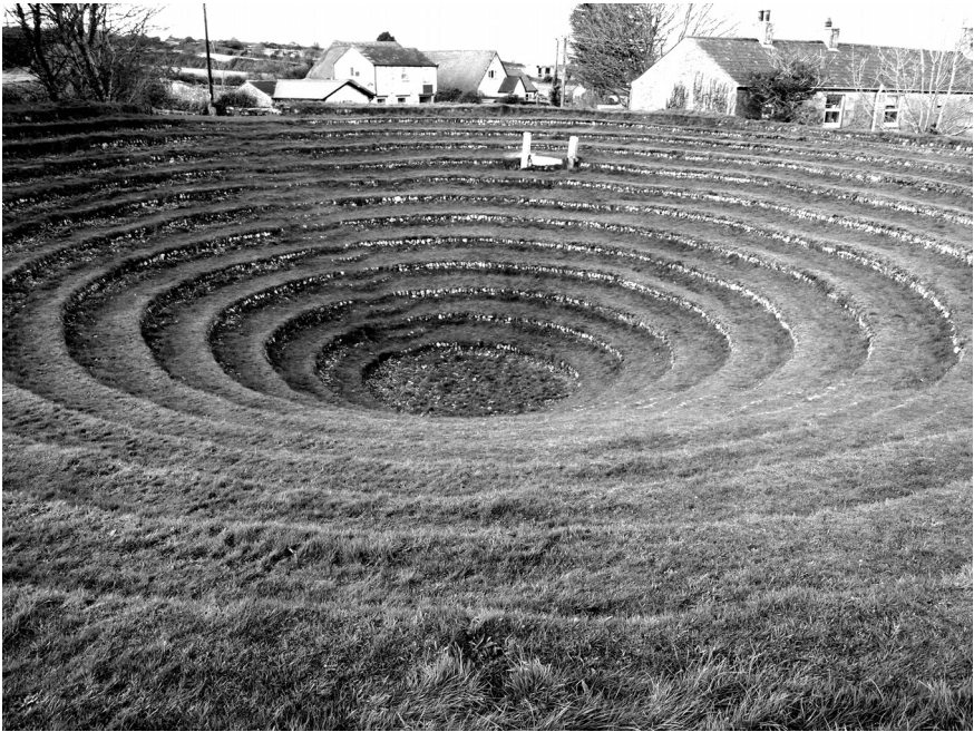
वेस्लीले २०,००० लाई प्रचार गरेको ग्वेन्नेप पिट (खाडलका गराहरू पछि बनाएको हो )

शक्ति प्रकट भएको थियो। एकपल्ट चारैतिरका मानिसहरू ठुलो स्वरले रुन थाले र अर्को पल्ट धेरै जना मानिसहरू मरेको जस्तै भुईँमा लडे। आत्मग्लानिले रुनेहरूको आवाजको बिचमा वेस्लीको आवाज सुन्न नसक्ने भयो। त्यो पुरानो मण्डलीको आँगनमा धेरै जना परमेश्वरसँग मिलापमा आए र उच्च स्वरले धन्यवाद दिए। एउटा भद्र मानिस जो तीस वर्षदेखि कुनै पनि प्रकारको सेवामा सहभागी हुनुभएको थिएन, प्रतिमा जस्तो निश्चल भएर उभिरहनुभएको थियो। वेस्लीले उहाँलाई सोध्नुभयो, 'साहेब, तपाईँ पापी हुनुहुन्छ?' उहाँले जवाफ दिनुभयो, 'पापी भन्दा पुग्छ त !' र माथि एकोहोरो हेरेर उभिरहनुभयो। अन्तमा उहाँकी श्रीमती र नोकर जो दुवै पनि रोइरहेका थिए, उहाँलाई कुर्सीमा बसाए, र पछि घर लगेर गए।