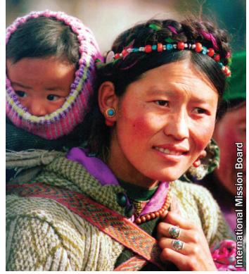
International Mission Board

धेरै वर्षहरूदेखि नै तिब्बत राष्ट्र इसाईत्वको एउटा चुनौतीको रूपमा रहँदै आएको छ। “तिब्बतमा